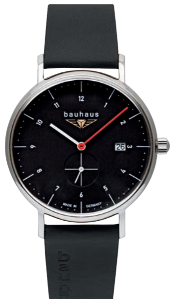
Quarz kleine Sekunde Quarz small second Ronda 6004.D | Mineral Crystal K1 | Date | wr 5 atm | Ø 41 mm Ref.: 2130-2*