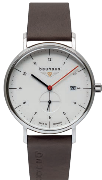
Quarz kleine Sekunde Quarz small second Ronda 6004.D | Mineral Crystal K1 | Date | wr 5 atm | Ø 41 mm Ref.: 2130-1*