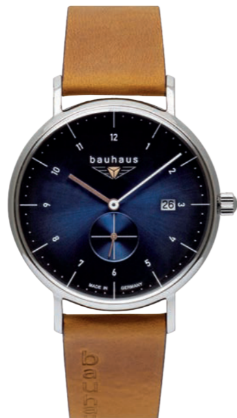
Quarz kleine Sekunde Quarz small second Ronda 6004.D | Mineral Crystal K1 | Date | wr 5 atm | Ø 41 mm Ref.: 2130-3*