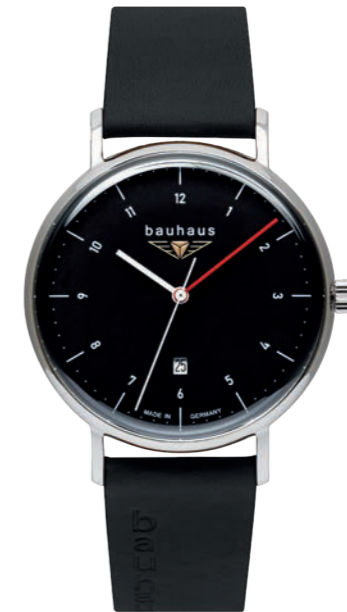
Quarz Ronda 505 | Mineral Crystal K1 | Date | wr 5 atm | Ø 41 mm Ref.: 2140-2*