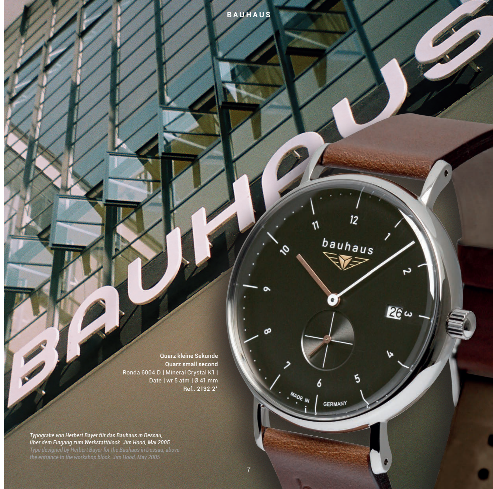
Quarz kleine Sekunde Quarz small second Ronda 6004.D | Mineral Crystal K1 | Date | wr 5 atm | Ø 41 mm Ref.: 2132-2*

* Für diese Uhrenmodelle ist ein Metallarmband separat erhältlich. For these models, a metal bracelet can be bought separately.