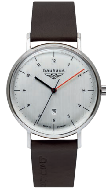
Quarz Ronda 505 | Mineral Crystal K1 | Date | wr 5 atm | Ø 41 mm Ref.: 2140-1*