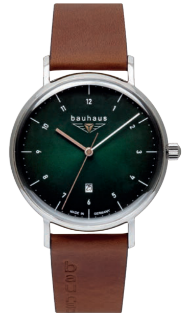
Quarz Ronda 505 | Mineral Crystal K1 | Date | wr 5 atm | Ø 41 mm Ref.: 2140-4*